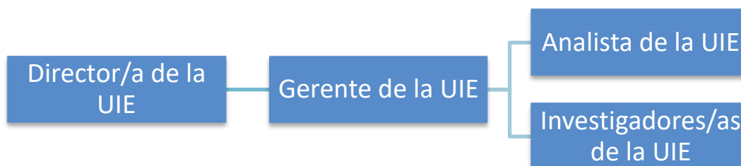
Ilustración 1. Estructura de la Unidad de Investigaciones Especiales.

El analista de la UIE realiza la recopilación y el análisis preliminar de datos para las investigaciones que llevarán a cabo los investigadores de la UIE. Cuando llegan los resultados de la investigación preliminar de los analistas de la UIE, los investigadores evalúan los historiales clínicos y realizan las investigaciones finales. La ilustración muestra la organización de la UIE.